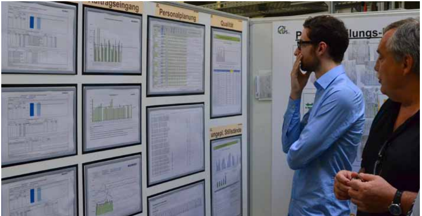
Personalplanung, Kennzahlen, oder Diagramme - diverse Informationen für alle Mitarbeiter auf einem Blick.

Ein weiteres Projekt ist der „Produktionsfilm“. Dieser ermöglicht, dass sich Nutzer entlang eines Zeitstrahls durch die Historie der Produktion bewegen, um an beliebigen Zeitpunkten Daten detailliert zu analysieren.