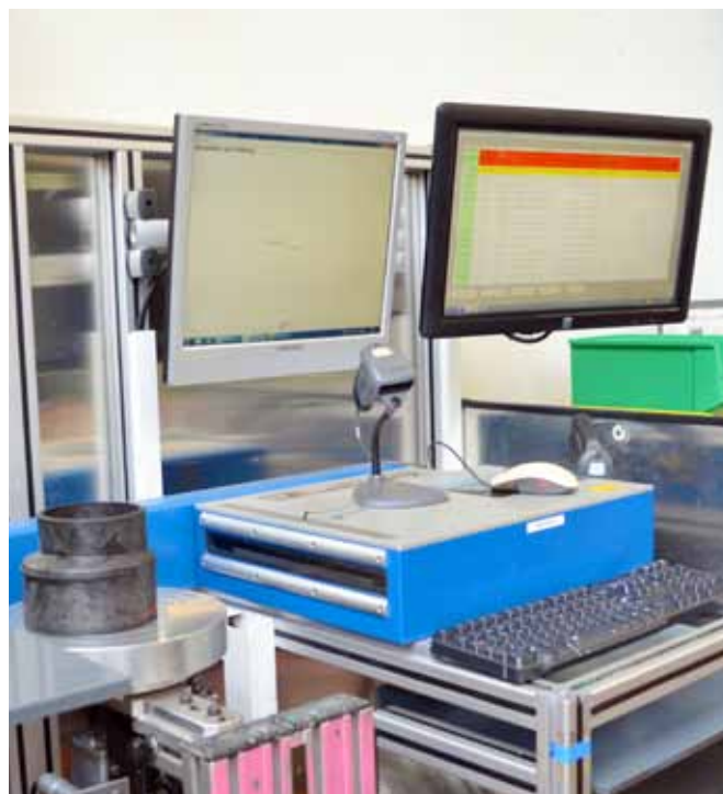
Qualitätsmanagement In-Line oder am Prüfplatz.

Die Einrichter melden sich für ihre unterschiedlichen