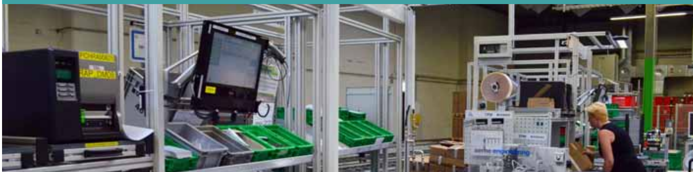
An den Handarbeitsplätzen nutzen die Mitarbeiter das Web-GT.

Die Produktion ist effizient geplant und wird vom Rohstoffeingang bis zum Warenversand lückenlos gesteuert. Das Resultat: Wenn ein Teil eine Maschine verlässt, erfüllt es die Anforderungen an hohe Qualität, ist richtig gelabelt, kundenfertig verpackt und richtig gebucht.