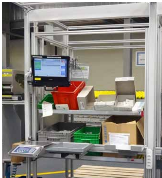
Alle Verbrauchsteile zuverlässig im Blick.

So kam 1986 der erste Kontakt zum Institut für Kunststoffverarbeitung (IKV) der RWTH Aachen zustande. Dort war im Rahmen einer Doktorarbeit ein Prozessdaten-Erfassungssystem für Spritzguss-Maschinen entwickelt